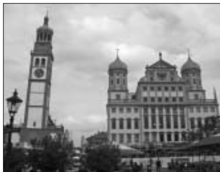
Das Rathaus von Augsburg

3. Tag Mittwoch, 30. Mai: Heimfahrt über Augsburg – Landsberg/Lech – Kloster Ettal – Mittenwald – Seefeld – Innsbruck – Salzburg – Neumarkt