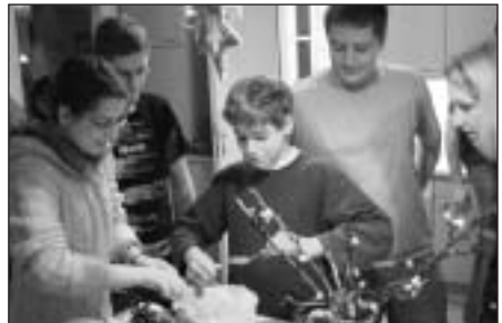
Der Kampf mit den Grießnockerln

Es fand im Februar bereits ein Spieleabend statt, Anfang März setzten sich die Jugendlichen und jungen Erwachsenen in einem Diskussionsabend zum Thema Abtreibung auseinander.